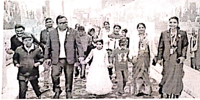
कार्यक्रम में भाग लेते विशेष आवश्यक वाले बच्चों की फाइल फोटो।

वर्ष 2016 में शहर के नसीबपुर में प्रारंभ हुई इस संस्था को अब जाकर अपना सेक्टर-1 में अपना भवन मिला है जिसके माध्यम से अधिक बच्चों को इस दिशा में