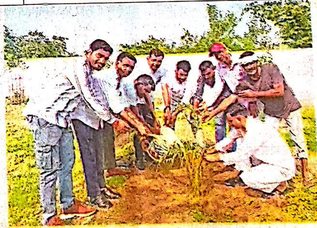
पौधारोपण करते हुए एसडीएम कनीना •