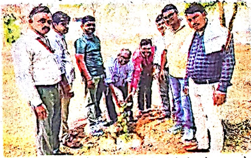
राजकीय पशु औषधालय बुचावास परिसर में पौधारोपण करते इंचार्ज व अन्य